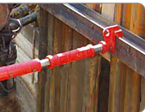
► Codal con cabezal para vigas HEB